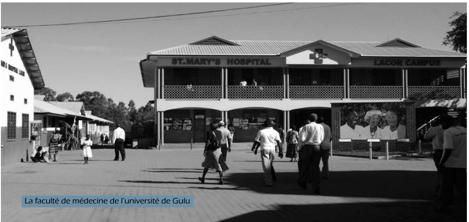
La faculté de médecine de l'université de Gulu

fesseur agrégé à la faculté de médecine de l'université de Gulu) : Dans les premières années, il a personnellement acheté pour nous des vélos que nous prenions jusqu'à l'université. » Il croit que pour étudier en médecine, il faut de la persévérance et un engagement personnel. Il conseille donc aux étudiants en médecine de maintenir leur concentration et leur détermination s'ils veulent réussir leurs études.